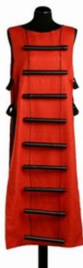
Ruggieri [Vedi la foto originale]